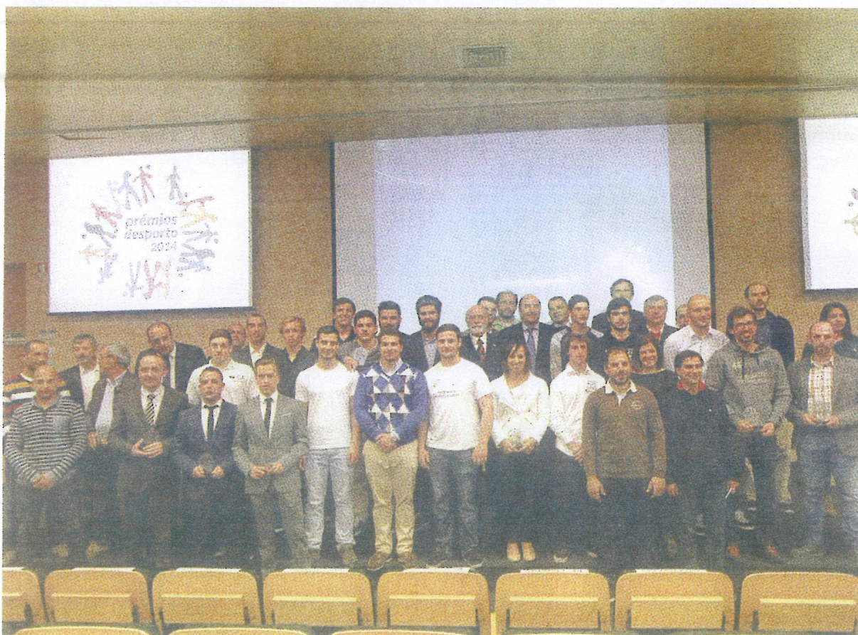
Cerimónia de entrega dos Prémios do Desporto decorreu no auditório da Fundação Bissaya Barreto P4 e 5