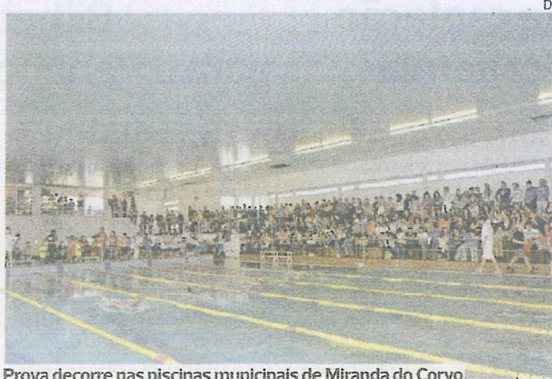
Prova decorre nas piscinas municipais de Miranda do Corvo

Segundo nota de imprensa enviada ao DIÁRIO AS BEIRAS, este ano estarão em competição 14 clubes,