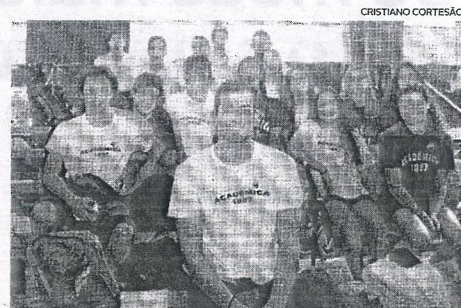
A Académica está representada nos Nacionais de Natação