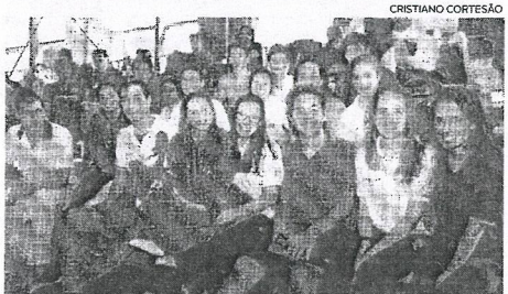
Atletas do Galitos nadaram e trouxeram boa disposição