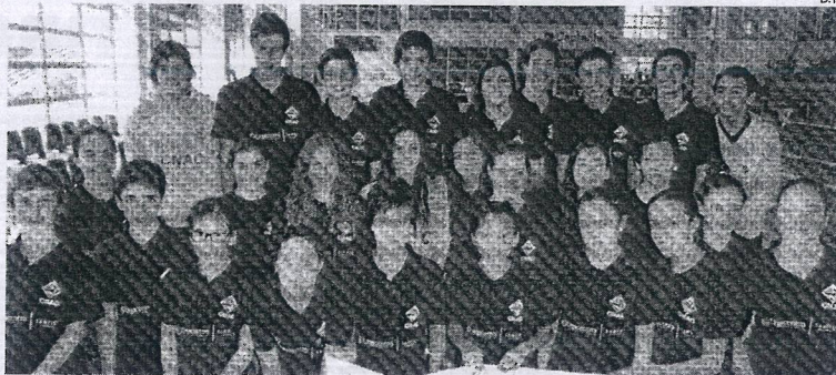
CNAC esteve representado por 25 atletas na Piscina Municipal de Cantanhede

Quanto aos clubes, foram vários os que conseguiram lugares de pódio, contrariando