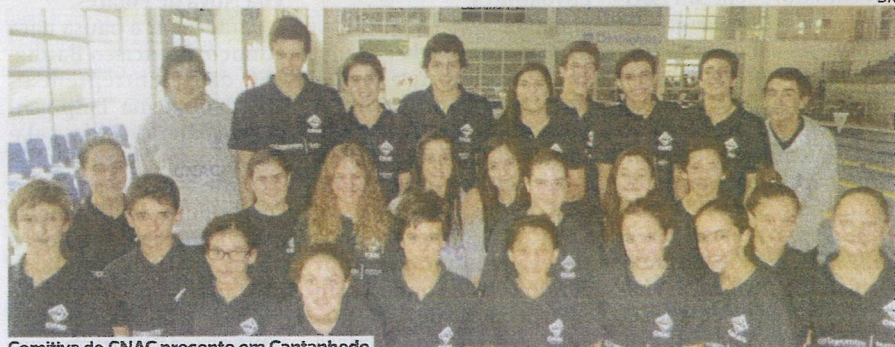
Comitiva do CNAC presente em Cantanhede

em que havia classificação coletiva através da soma de pontos dos três primeiros classificados de cada clube por categoria, vitória para o Clube Náutico Académico de Coimbra (14.401 pontos), seguido do Clube Náutico de Miranda do Corvo (10.931) e Fundação Beatriz Santos (8.451).