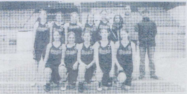
Olivais acabou no derradeiro lugar da competição