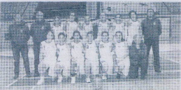
Sp. Figueirense redimiou-se da derrota nas "meias" e ficou em 3.º