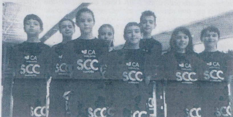
Foi com uma prestação muito boa que os nadadores da Sociedade Columbófila saíram deste XVI Torneio do Sporting Clube de Braga

Os nadadores da SCC aproveitaram ainda a participação neste Torneio de Braga, para se prepararem para o Torneio Nadador Completo, prova que se realizará nas piscinas municipais de Condeixa.■