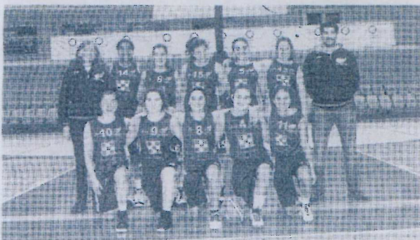
Columbófila Cantanhedense deu réplica na final

Basquetebol Estudantes não deram hipóteses à concorrência. Columbófila ficou em 2.º, enquanto Sport Figueirense e Olivais ocuparam os restantes lugares