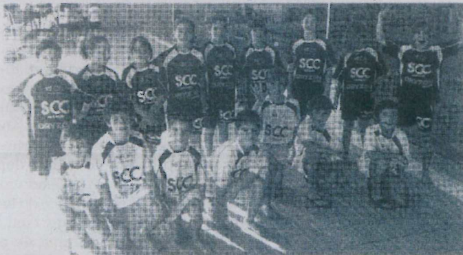
Ao todo, foram 16 os atletas de Cantanhede a participar no evento

Estas jovens promessas estiveram a altura, tendo demonstrado que o empenho e a assiduidade são importantes para a sua evolução.