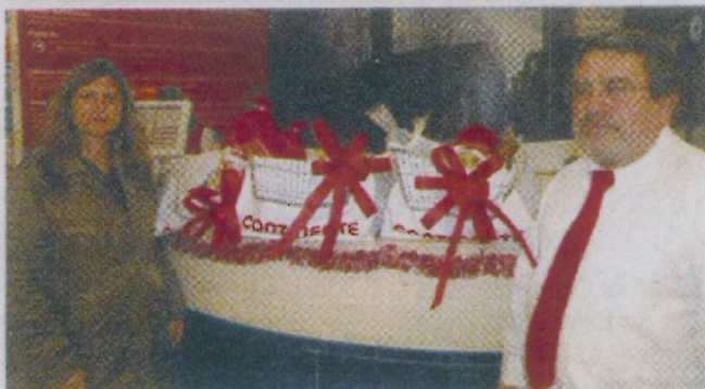
O departamento de Ação Social da Sociedade Columbófila vai visitar e entregar às famílias um cabaz de produtos da marca Continente

Foi graças à renovação da parceria com a insígnia Continente – Hipermercados e também à colaboração da Fundação Belmiro de Azevedo, que foi possível concretizar esta iniciativa que vai certamente proporcionar a muitas famílias encher a mesa da ceia de Natal e proporcionar uma noite especial para toda a família, na qual os valores como a solidariedade e fraternidade ganham ain-