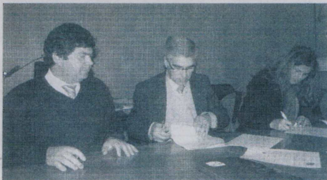
Protocolo foi assinado a 10 de dezembro

Através deste protocolo o Crédito Agrícola mantém a sua imagem associada à da SCC, dando assim, mais