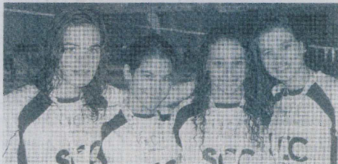
Participação dos nadadores da Associação de Solidariedade Social Sociedade Columbófila Cantanhedense permitiu escrever mais uma bonita página do seu historial

Em termos individuais é ainda de realçar os acessos a 6 finais A e 6 Finais B, foram ainda obtidos durante estes Campeonatos 4 novos recordes regionais.■