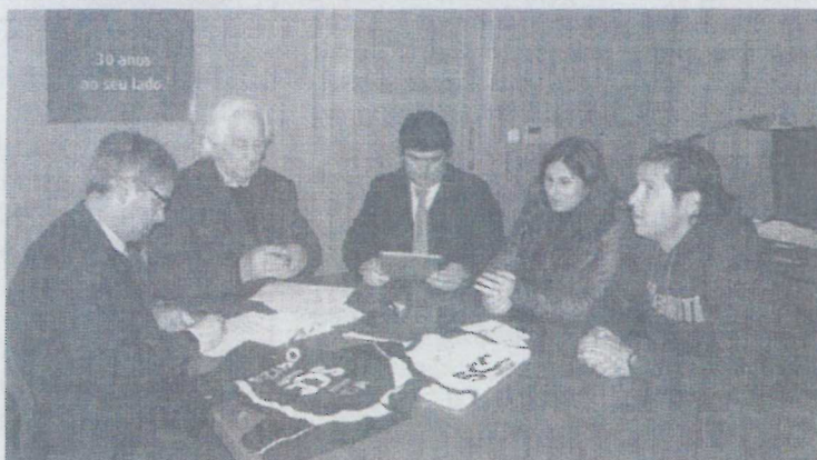
Através deste protocolo o Crédito Agrícola mantém a sua imagem associada à da SCC, dando assim, visibilidade a esta parceria através do equipamento dos atletas, da imagem no site e no pavilhão, com de vários suportes de comunicação

Através deste protocolo o Crédito Agrícola mantém a sua imagem associada à da SCC, dando assim, visibilidade a esta parceria através do equipamento dos atletas, da imagem no site e no pavilhão, com de vários suportes de comunicação.