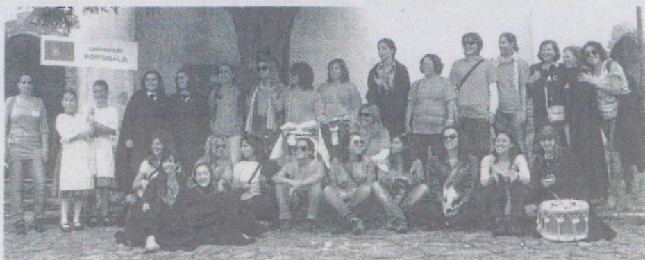
Columbófila participou no Eurofestival com uma das suas maiores delegações de sempre

Para além da prestação do Rancho e Orquestra Típica da secção de fado da Associação Académica de Coimbra, que em parceria com a Associação de Solidariedade Social Sociedade Columbófila Cantanhedense nos últimos anos tem permitido "mostrar" o que melhor temos do Folclore e da Etnografia, os resultados desportivos foram igualmente aceitáveis e que permitiu no final a delegação que representou o nosso país classificar-se em quin-