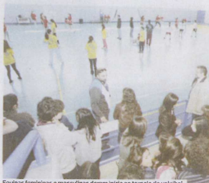
Equipas femininas e masculinas deram início ao torneio de voleibol