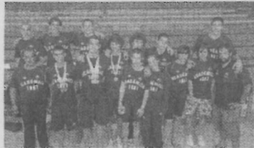
ACADÉMICA em destaque no "Nacional" de Rio Maior