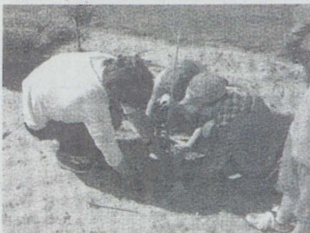
Crianças participaram na iniciativa "Onde está o ovo"

Com atividades dirigidas a crianças, alunos das Escolas do 1.º e 2.º Ciclo do Ensino Básico do concelho de Cantanhede, a iniciativa "Onde está o ovo", decorreu em vários espaços da cidade e concelho de Cantanhede.