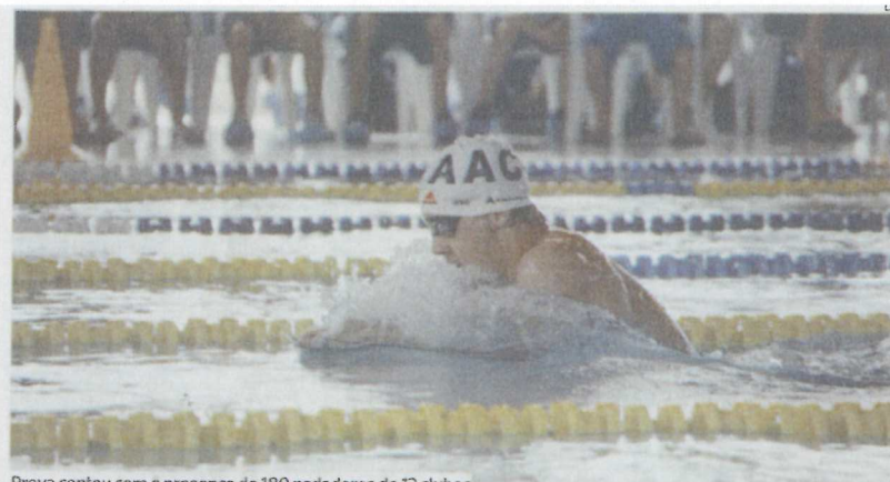
Prova contou com a presença de 189 nadadores de 12 clubes

REVISTA DE IMPRENSA SECÇÃO: NATACÃO – Data - 4 – MAIO - 2011 TIRAGEM MÉDIA 12.000 –