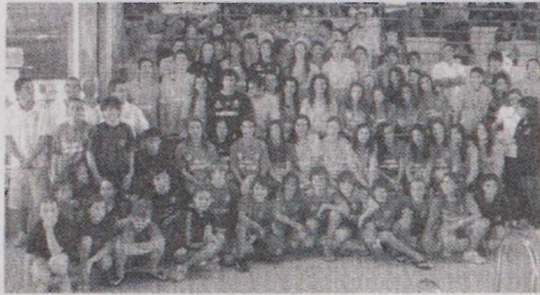
O NÁUTICO/MATOBRA apresentou 72 atletas em competição

O Náutico/Matobra apresentou 72 atletas, 35 masculinos e 37 femininos sendo a equipa mais numerosa. A Académica participou com 27 atletas, o Ginásio com 22 e a Columbófila/Oriзон com 20. Náutico de Miranda (16), Junta Freguesia Paão (14), Clube Infante Montemor (9), Lousanense (7), Fundação Beatriz Santos (7) e Vigor (6) completaram o lote de participantes.