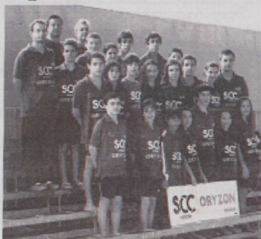
Equipa obteve 61 recordes pessoais nas 80 provas nadadas

que nesta competição foram obtidos melhores resultados do que em